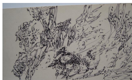
unbenannt undatiert Filzstift auf Papier 12 x 20.5 cm verso u.l. (von fremder Hand): S/ZA 3

© Hans-Joachim Rose