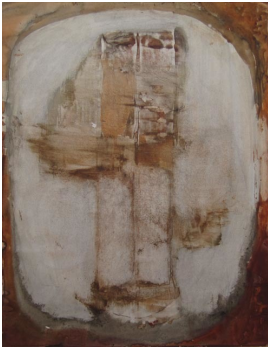
© Hans-Joachim Rose Foto: Thomas Kumlehn