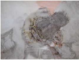
© Hans-Joachim Rose Foto: Thomas Kümlehn

unbenannt [Landschaft/Traum/Draufsicht] Becky Sandstede (Künstler/in), undatiert [um 1970-80]