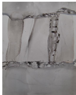
unbenannt undatiert Aquarell auf Aquarellkarton

© Hans-Joachim Rose Foto: Thomas Kümlehn