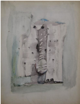
© Hans-Joachim Rose Foto: Thomas Kumlehn