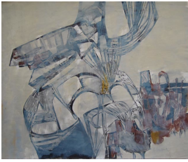
© Hans-Joachim Rose Foto: Thomas Kumlehn