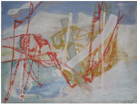
© Hans-Joachim Rose Foto: Thomas Kumlehn