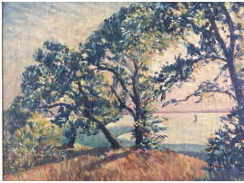
© Erika Bauer Foto: Annette Purfürst