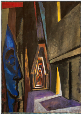
© VG Bild-Kunst, Bonn; Prof.-Ronald-Paris-Stiftung, Rangsdorf/VG Bild-Kunst, Bonn Foto: Wolfgang Lücke