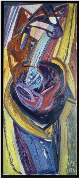
© VG Bild-Kunst, Bonn; Rose und Otto Schack