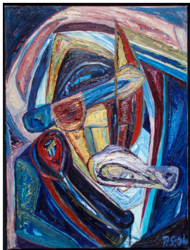
© VG Bild-Kunst, Bonn; Rose und Otto Schack