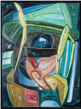
© VG Bild-Kunst, Bonn; Rose und Otto Schack