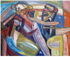
© VG Bild-Kunst, Bonn; Rose und Otto Schack