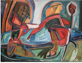
© VG Bild-Kunst, Bonn; Rose und Otto Schack