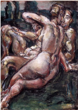
© VG Bild-Kunst, Bonn; Prof.-Ronald-Paris-Stiftung, Rangsdorf/VG Bild-Kunst, Bonn