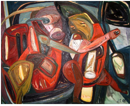
© VG Bild-Kunst, Bonn; Rose und Otto Schack