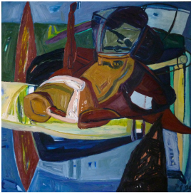
© VG Bild-Kunst, Bonn; Rose und Otto Schack Foto: unbekannt

Nachlass: Schack, Philipp [Werkverzeichnis Malerei] Werkverzeichnis-Nr.: 201 Objekttyp: Gemälde Gründe der Datierung (Freitext): Sign. recto + Bez. verso