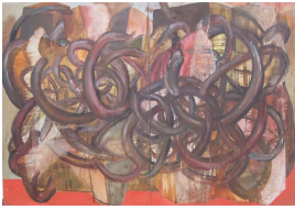
© Hannelore Kehrwald, Roland Kehrwald Foto: Thomas Kumlehn