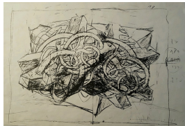
Klaus Kehrwald unbenannt undatiert Bleistift auf Papier 29,7 x 42 cm

© Hanne Kehrwald, Roland Kehrwald