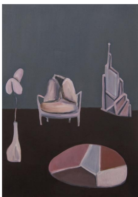
© Hannelore Kehrwald, Roland Kehrwald Foto: Thomas Kumlehn