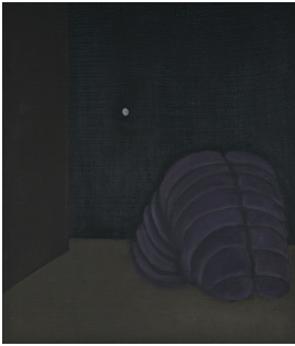
© Hannelore Kehrwald, Roland Kehrwald Foto: Thomas Kumlehn