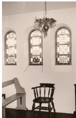
Dreifaltigkeitsfenster und Lichtkrone, Stephanuskirche, Kiel-Kroog, Chorsakristei