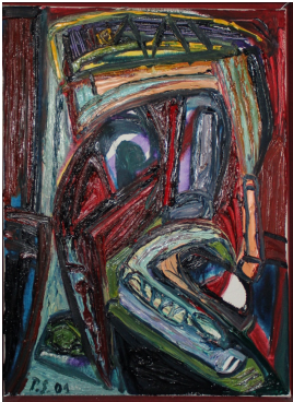
© VG Bild-Kunst, Bonn; Rose und Otto Schack Foto: unbekannt