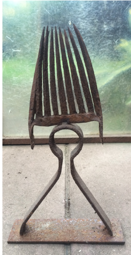
Kleiner König 2000/01 Stahl, geschweißt 62 x 36 x 10 cm

© VG Bild-Kunst, Bonn; Rose und Otto Schack