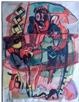
König 1994 Mischtechnik/Papier 63 x 48 cm

© VG Bild-Kunst, Bonn; Rose und Otto Schack