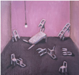
© Hannelore Kehrwald, Roland Kehrwald Foto: Thomas Kumlehn