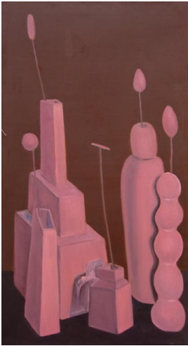
© Hannelore Kehrwald, Roland Kehrwald Foto: Thomas Kumlehn