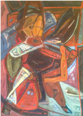
© VG Bild-Kunst, Bonn; Rose und Otto Schack