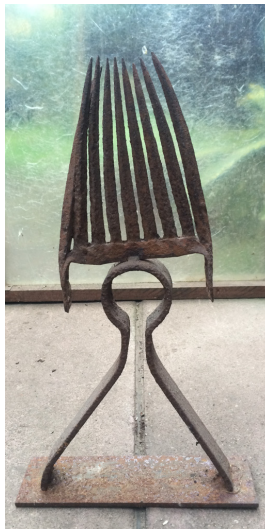
Kleiner König 2000/01 Stahl, geschweißt 62 x 36 x 10 cm

© VG Bild-Kunst, Bonn; Rose und Otto Schack