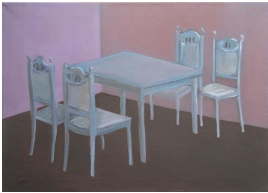
© Hannelore Kehrwald, Roland Kehrwald