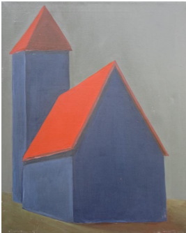
© Hannelore Kehrwald, Roland Kehrwald Foto: Thomas Kumlehn