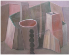
© Hannelore Kehrwald, Roland Kehrwald Foto: Thomas Kumlehn