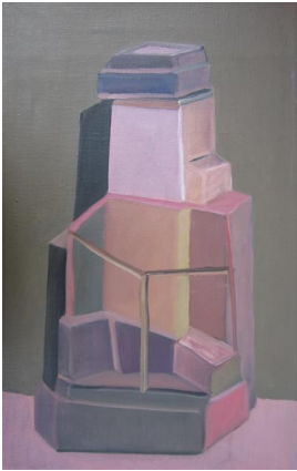
© Hannelore Kehrwald, Roland Kehrwald Foto: Thomas Kumlehn