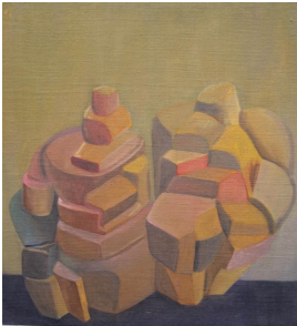
© Hannelore Kehrwald, Roland Kehrwald Foto: Thomas Kumlehn