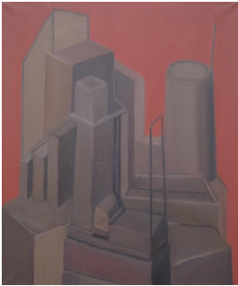
© Hannelore Kehrwald, Roland Kehrwald Foto: Thomas Kumlehn