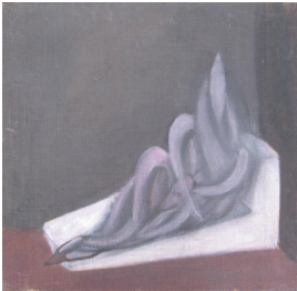
© Hannelore Kehrwald, Roland Kehrwald Foto: Thomas Kumlehn