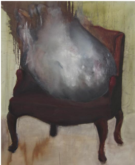
© Hannelore Kehrwald, Roland Kehrwald Foto: Thomas Kumlehn