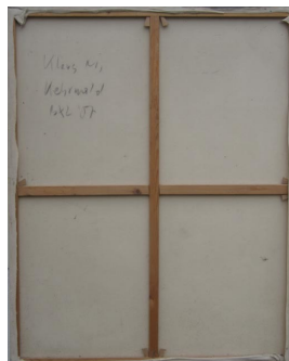
Herz V (verso) 1987 Öl, Lack auf Nessel 165 x 130 cm

© Hannelore Kehrwald, Roland Kehrwald