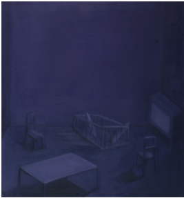
© Hannelore Kehrwald, Roland Kehrwald Foto: KEHRWALD-ARCHIV

Nachlass: Kehrwald, Klaus [Nachlassverzeichnis Malerei] Nachlass-Nummer: 082 Objekttyp: Gemälde Entstehungsort: Atelier, Berlin