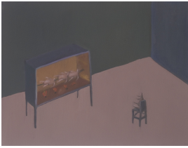
© Hannelore Kehrwald, Roland Kehrwald Foto: KEHRWALD-ARCHIV