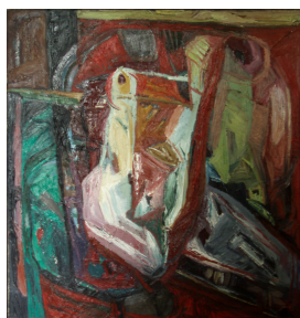
© VG Bild-Kunst, Bonn; Rose und Otto Schack Foto: Thomas Kumlehn

Nachlass: Schack, Philipp [Werkverzeichnis Malerei] Werkverzeichnis-Nr.: 155 Objekttyp: Gemälde Gründe der Datierung Sign. recto + Bez. verso (Freitext):