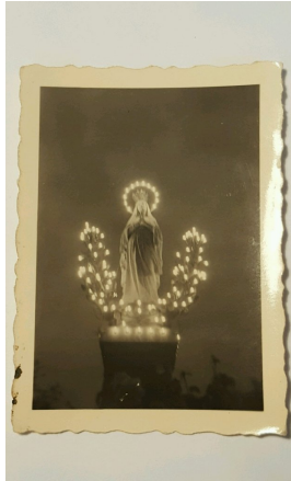
La basilique et la Vierge couronnée, Lourdes (hier festlich erleuchtet) Abbildungsvorlage: s/w Papier