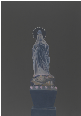
© Hannelore Kehrwald, Roland Kehrwald Foto: KEHRWALD-ARCHIV