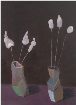
© Hannelore Kehrwald, Roland Kehrwald Foto: KEHRWALD-ARCHIV