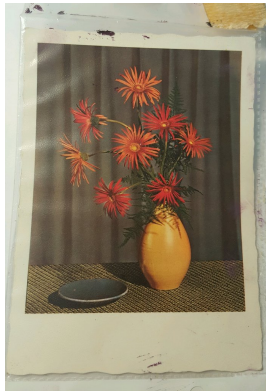
Postkarte Blumenvase und Teller Abbildungsvorlage: Farbe Papier