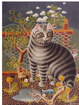
Katze mit Fisch, 1980 Tempera und Öl auf Holz 52 x 39.5 cm