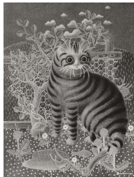
Entwicklungsphase zu Katze mit Fisch, 1980 Tempera und Öl auf Holz 52 x 39.5 cm