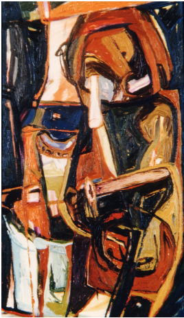
© VG Bild-Kunst, Bonn; Rose und Otto Schack