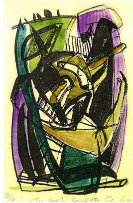
Das zweite Gesicht 1998 Lithografie/aquarelliert Auflage 26/30 Maße unbekannt

© VG Bild-Kunst, Bonn; Rose und Otto Schack