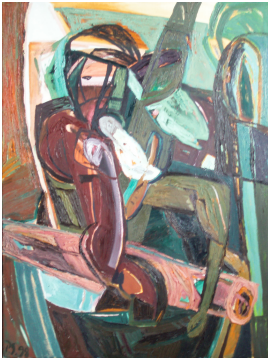
© VG Bild-Kunst, Bonn; Rose und Otto Schack

Nachlass: Schack, Philipp [Werkverzeichnis Malerei] Nachlass-Nummer: 36 Werkverzeichnis-Nr.: 125 Objektyp: Gemälde Gründe der Datierung: Sign. recto + Bez. verso (Freitext):