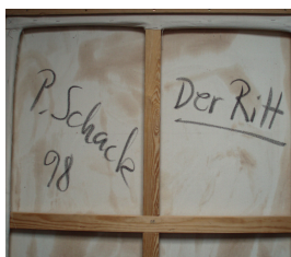
Der Ritt (verso) 1998 Öl/Leinwand 115 x 86 cm

© VG Bild-Kunst, Bonn; Rose und Otto Schack