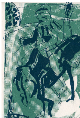
"Einen guten Ritt 1996 ..." Karte zum Jahreswechsel 1995 Farbsiebdruck 14,7 x 10,5 cm

© VG Bild-Kunst, Bonn; Rose und Otto Schack Foto: Thomas Kümlehn