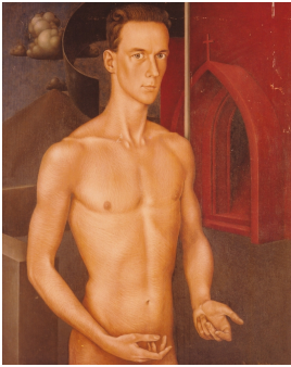
© Ute Boeters Foto: unbekannt / Foto: Sammlung Dr. Heinz Müller im Potsdam Museum - Forum für Kunst und Geschichte, Potsdam