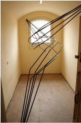
© Sophie Roock Foto: Bildarchiv Nachlass Rainer Fürstenberg