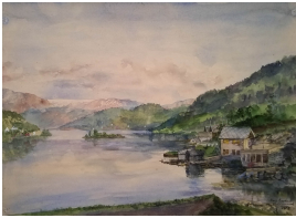
© gemeinfrei; Erben unbekannt; Margarete Martus Foto: Thomas Kumlehn