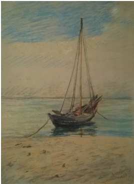
© gemeinfrei; Erben unbekannt; Margarete Martus Foto: Thomas Kumlehn