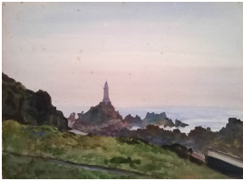
© gemeinfrei; Erben unbekannt; Margarete Martus Foto: Thomas Kumlehn