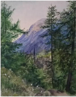
© gemeinfrei; Erben unbekannt; Margarete Martus Foto: Thomas Kumlehn