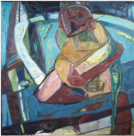
© VG Bild-Kunst, Bonn; Rose und Otto Schack Foto: Thomas Kümlehn

Nachlass: Schack, Philipp [Werkverzeichnis Malerei] Nachlass-Nummer: 35 Werkverzeichnis-Nr.: 116 Objektyp: Gemälde Gründe der Datierung (Freitext): Bez. verso