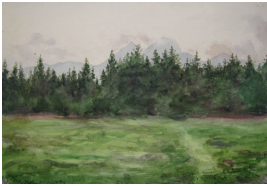
© gemeinfrei; Erben unbekannt; Margarete Martus Foto: Thomas Kumlehn