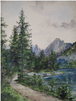
© gemeinfrei; Erben unbekannt; Margarete Martus Foto: Thomas Kumlehn